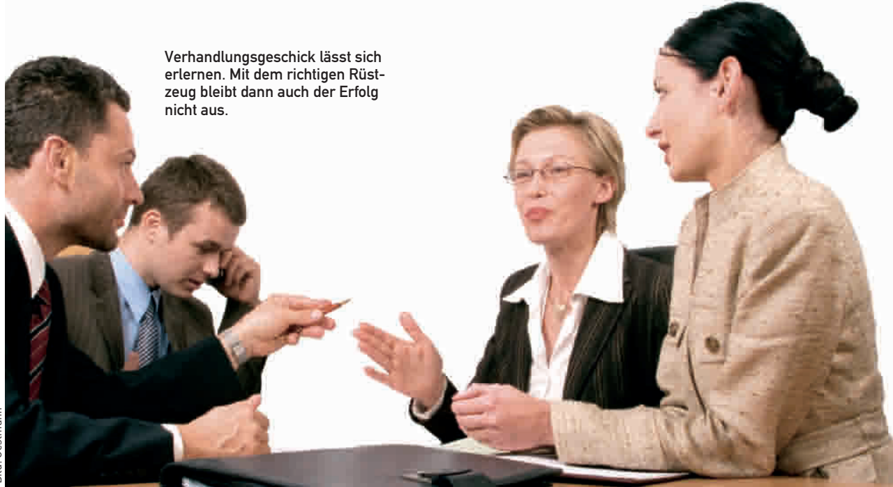
Verhandlungsgeschick lässt sich erlernen. Mit dem richtigen Rüstzeug bleibt dann auch der Erfolg nicht aus.

Im Training üben die Vertriebsmitarbeiter, wie sie den Kontakt zum Verhandlungspartner optimieren, per Smalltalk die Beziehung stärken und eine gute Gesprächsatmosphäre schaffen. Dies sei zumindest bei den Personen leichter, deren Interessen und Hobbys man bereits kennt, etwa bei den Einkäufern langjähriger Kunden. Wichtig sei es aber, stets Sach- und Beziehungsebene zu trennen, erfahren die Seminarteilnehmer. Ebenso käme es darauf an, auf keinen Fall